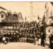
倉庫前に集結した会社幹部と広告部長