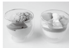
PV特製ソフトジェラート