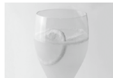
自家製リモナータ