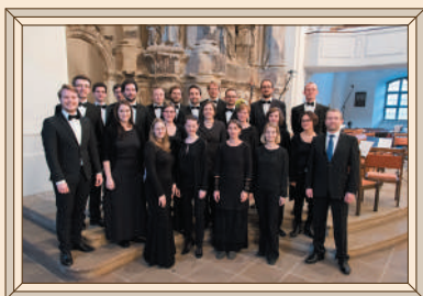
ザクセン声楽アンサンブル SÄCHSISCHES VOCALENSEMBLE

2009年5月には「プラハの春」音楽祭に出演して絶賛された。同年9月に初来日し、東京、大阪、神戸、大津でコンサートとワークショップを開催。その至純のアカベラで多くの聴衆を魅了した。創設以来、ドイツ各地の公共放送と収録契約を結び、またライブツィヒ・バッハ・フェスティバル、ドレスデン音楽祭、ゲッティンゲン国際ヘンデル・フェスティバル、ラインガウ音楽祭、ハレ・ヘンデル音楽祭などの著名なフェスティバルに招かれている。国際的には、とくにバッハ作品の解釈によって注目を集めている。バッハのモテット集のCD収録は、2002年、権威あるカンス・クラシック音楽賞を受賞した。その他、シュッツ、テレマン、ロッチェ、ハッセ、ホミリウス、メンデルスゾーン、シューマン、バルメリなどCDリリースも35枚に上り、幾多の賞を獲得している。今回の創設30周年記念ツアーは2009年、2011年、2016年、2019年に続き5度目の来日となる。